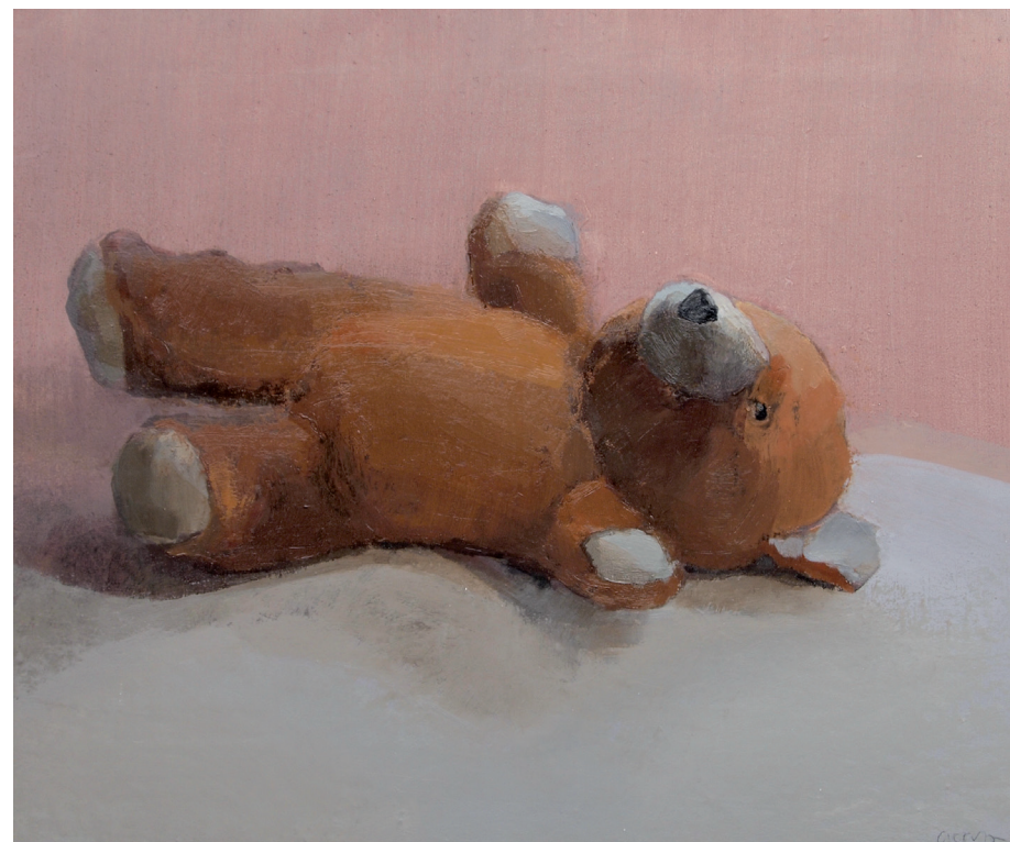
"Oso" . Acrílico y óleo sobre soporte rígido. 40x50cm. (2010)